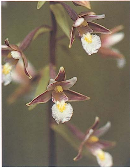
Sump-Hullæbe, Sten Moeslund

Søen er lavvandet med en gennemsnitsdybde på cirka 1 meter. Vandkvaliteten er dårlig med høj næringsstofkoncentration. Selsø Sø modtager via Selsø Kanal vand fra vandløbene Dybemosen og Ventegrøften, som kommer fra nord. Udløbet fra Selsø Sø til Roskilde Fjord er reguleret med højvandssluse, som lukker, når vandet stiger i fjorden.