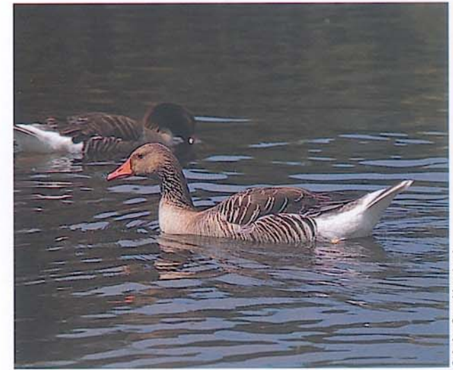
Grågås, Sten Moeslund

Selsø Sø og engene omkring søen er en af Sjællands bedste lokaliteter for vandfugle. Her yngler flere arter af Lappedykker, Knopsvane, Grågås, flere arter af ænder, Blishøns, Vibe, Rødben og Dobbeltbekkasin samt en række spurvefugle. Gennem de sidste 10 år er søen blevet tilholdssted for Skarv, som har sin nærmeste koloni på Bognæs. Om vinteren kan søen være tilholdssted for meget store flokke af Troldænder og Blishøns.