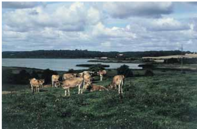
Græssende kreaturer holder bakkerne ved Vejlbj Kirke fri for træer og anden bevoksning, så udsigten over Rands Fjord mod herregården Nebbegård bevares.

Fjorden er i dag en stor ferskvandssø på 140 ha. og dermed en af de største i området. Elbodalen udmundning blev i midten af 1800-tallet afsnøret fra Vejle Fjord ved inddæmning og således gradvist omdannet til en stor ferskvandssø. Spang Å leder sit vand ind i søens vestende, og i østenden er afløb gennem en gravet kanal og sluse til den oprindelige fjordmunding ved Hølsminde.