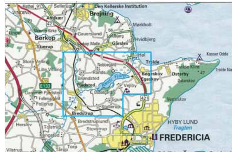
Trekantområdet, hvor Elbodalen forbinder Kolding og Vejle fjorde. Rands Fjord ligger som en stor inddæmmed sø omgivet af afvekslende natur og byder på mange turmuligheder.

Landskabsfredningen omfatter mere end 1000 ha omkring Rands Fjord. Samtidig med beskyttelse af områdets naturmæssige værdier har fredningen betydet, at der kunne laves stier og opholdsarealer omkring søen, så der herved er blevet bedre adgang til området.