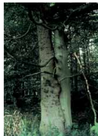
Et sammenvokset bøge- og egetræ - resultatet af årtiers kamp om lyset i skovbrynet på sydsiden af Brøndsted Skov.

I skoven ca. 300 m sydvest for Nebbegård kan voldstedet fra det middelalderlige Nebbe Slot endnu ses. Det var her Valdemar Atterdag i 1348 sluttede forlig med de holstenske grever om indløsning af Fyn.