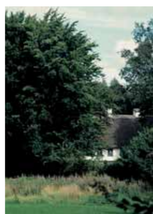
"Fagerli" - maleren, billedhuggeren og naturfredningsforkæmperen Søren Anius' hus.