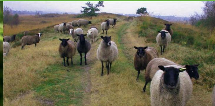
Får er med til at holde landskabet åbent