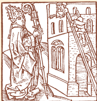
Sankt Søren – eller Severinus på latin

Der er dog næppe belæg for denne historie, som må tilskrives den lokale tradition. Legenden om den katolske helgen Sankt Søren er sandsynligvis en sammensmeltning af to legender fra omkring år 400 – den ene om en biskop fra Bordeaux og den anden om en biskop fra Køln.