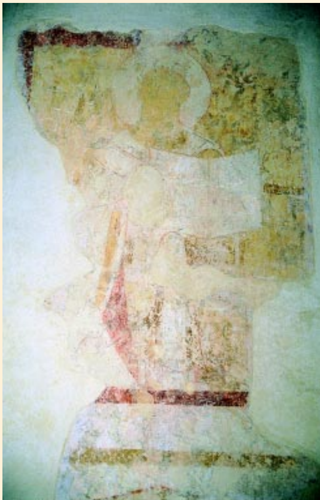
Ærkebiskop med åben bog – antageligt Sankt Peter Kalkmaleri fra Skanderup Kirke