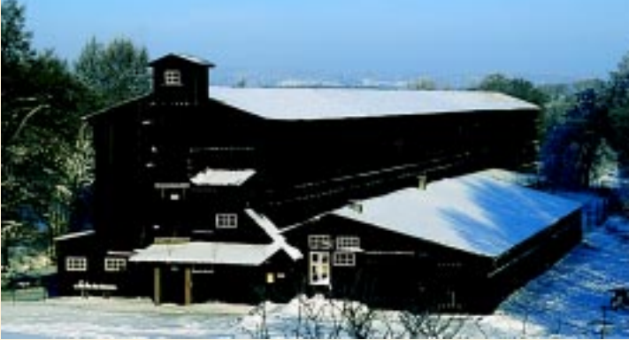
Klostermøllefabrikkens tørrelade – til tørring af rå pap

Klostret ejede adskillige ejendomme i området frem til reformationen i 1536. I 1552 blev klostret underlagt lensmanden på Skanderborg Slot, og den sidste munk blev overflyttet til Øm Kloster. I 1560 var klosterkirken endnu intakt, men blev nedrevet kort tid efter. Rester af munkesten og en spændende flora af lægeurter vidner endnu om munkenes aktiviteter i området.