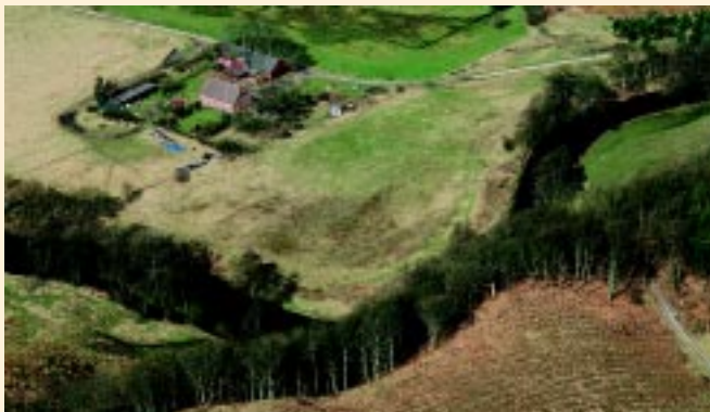
Ejendommen Gl. Vissing Kloster og Gudenåen

Vissing Klosters tomt ligger gemt under jorden mellem Gudenåen og den privatejede ejendom Gl. Vissing Kloster. Der er kun foretaget en mindre undersøgelse af stedet i 1915, og der vides ikke meget om klostret. Det var benediktinernonner, som beboede klostret fra dets grundlæggelse før 1250 og frem til dets nedlæggelse o. 1450, da klostrets gods blev lagt under Voer Kloster.