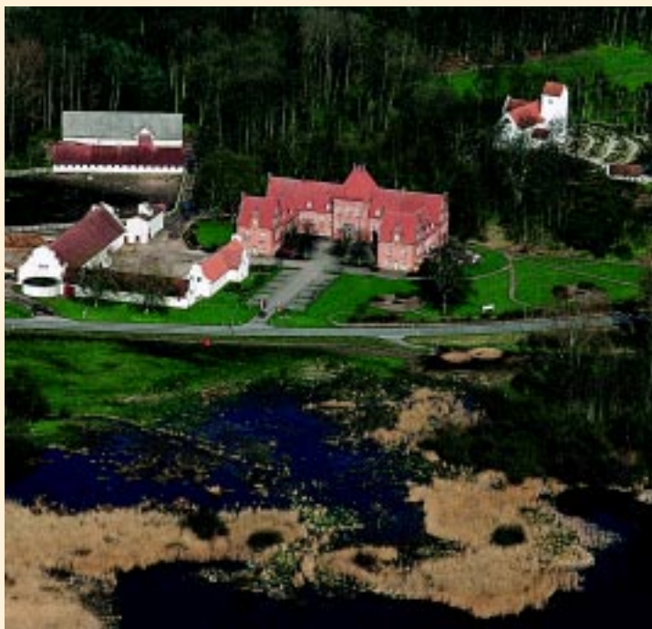
Veng Kirke og Sophiendal Gods