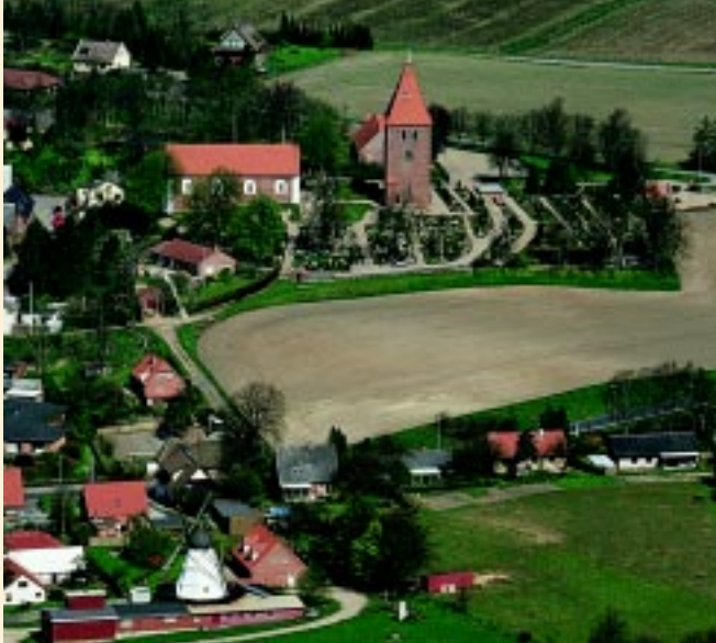
Sankt Søren's Kirke