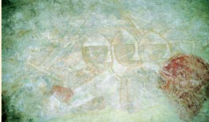
Detalje fra kampscene. Kalkmaleri fra Skanderup Kirke

Cistercienserne indførte bl.a. en ordning med lægbrødre – brødre, der havde aflagt klosterløfte uden dog at deltage i klosterlivet, som de egentlige munke.