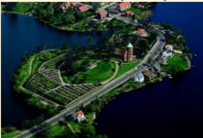
Skanderborg Slotskirke og slotsbanke

Skanderborg Slot blev nedrevet i 1767. Kun slotskirken blev tilbage. I kirken, som i dag er en af byens sognekirker, er endnu bevaret en del inventar fra Frederik 2.'s tid.