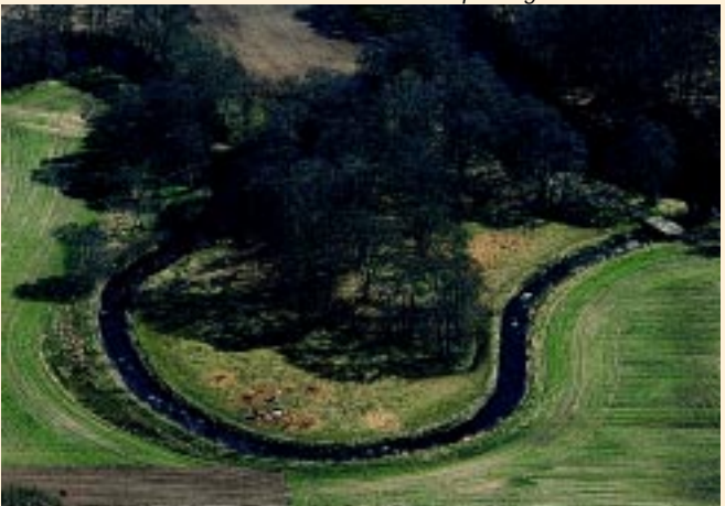
Faunapassagen ved Riværket

De eksisterende bygninger er rester af en fabriksvirksomhed, som fungerede fra 1872-1974. Klostermølle blev erhvervet af Miljøministeriet i 1975 og administreres i dag af Silkeborg Statskovdistrikt. Her er bl.a. kanolejrplads, kursusjendom, naturskole m.m. Det omgivende landskab kan opleves fra bl.a. fugletårnet i den store tørrelades nordgavl og fra Sukkertoppen.