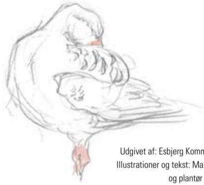
Udgivet af: Esbjerg Kommune, 2008 Illustrationer og tekst: Marco Brodde og plantør Claus Løth Tryk: Grafisk Produktion, Ribe

På Marbækgård ved søerne vises også en udstilling om områdets natur. Gården drives i dag som restaurant. Ved Sjelborg Strand ligger restaurant, »Rødhætte« med god udsigt over bugten. Syd for Sjelborg Plantage ligger Sjelborg Camping. Nordøst for Marbæk Plantage findes to 18 hullers golfbaner.