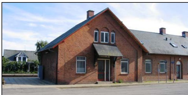
Gørding Station med SWEET-HOME i baggrunden

Gørding By har et udbredt stisystem, hvorpå der må cykles, og af grønne områder skal nævnes Verdensskoven og byens lystanlæg. Gørding har også et af de bedste bevarede stationsby miljøer med gamle huse fra jernbanens indvielse 1874, men er også en moderne by med gode forretninger - børnehaver skole – idrætsfaciliteter – plejecenter m. m.