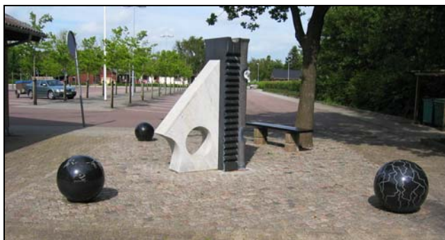
”Oasen” ved Gørding Idræts og kulturcenter