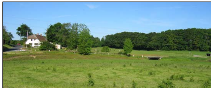
Lourup bro med tidligere købmandshandel og skole