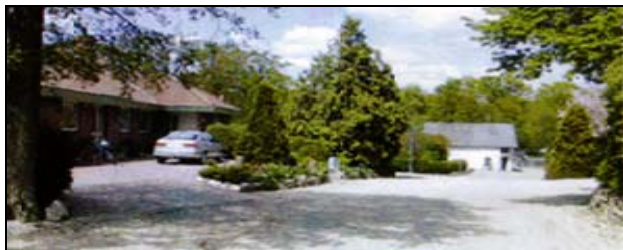
Gørding Møllegård med den i baggrunden liggende gamle vandmølle bygning

Cykelruter er lavet af Lokalhistorisk Forening i samarbejde med lokalarkiverne og Bramming Bibliotek og Kommune. Du kan også finde dem på bibliotekets hjemmeside www.brammingbibliotek.dk under ”Cykelruter”