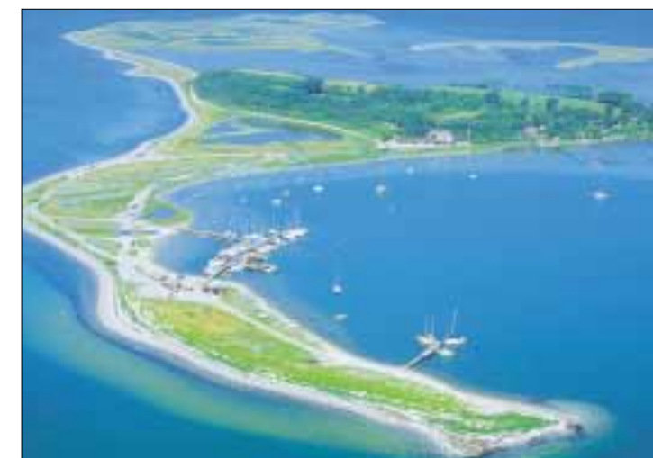
Korshavn i forgrunden og Fyns Hoved i baggrunden.

Siden århundredskiftet har fiskere fra Kerteminde fisket fra Korshavn. I dag holder 3-4 fiskekuttere til her. Dybt vand tæt på land og store sten giver gode muligheder for torsk.