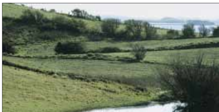
De mange begn på Fyns Hoved

Fyns Hoved ligger i landsbyen Nordskovs ejerlav. Byens jorder og dermed Fyns Hoved hørte under Scheelenborg gods. I 1200-tallet tilhørte godset den fredløse Marsk Stig. Navnet Røverdalen på Fyns Hoved skulle hentyde til Marsk Stig og hans folk, der gemte sig herude.