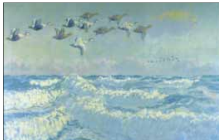
Edderfugle af Johannes Larsen (Original i Folketinget)

Fyns Hoved ligger i det tørre Storebæltssområde, hvor nedbøren er ca. 450 mm om året. Lands gennemsnittet er 650 mm om året. Det specielle klima giver grobund for planter, der normalt vokser i det tørre sydøsteuropæiske fastlandsklima. Udbredelsen af skærmpflanter Hjørtetrod følger området med ringe nedbør.