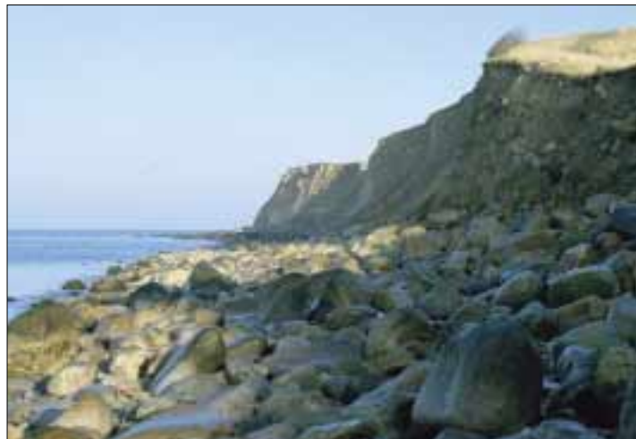
Store sten er aflejret højt oppe i skrænten