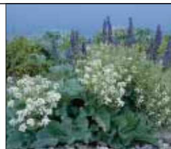
Strandkål og Slangehoved på strandvoldene i højsommeren