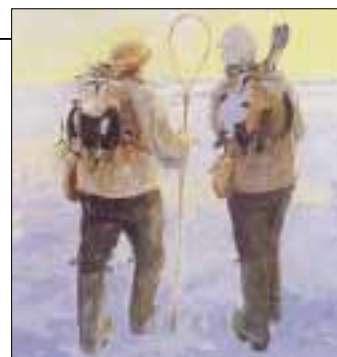
"Edderfuglejægere" malet af Johannes Larsen. Det er kunstneren til højre. (Original på Johannes Larsen Museet).

Ligesom ved Skagen er her hav på flere sider - det giver et helt specielt lys. I 1870'erne malede Th. Philipsen på Fyns Hoved og siden har mange kunstnere været tiltrukket af stedet. Johannes Larsen og Fritz Syberg holdt til heroppe med familie og venner omkring århundredskiftet.