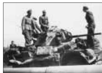
Kapitulationen på Fyns Hoved fandt først sted, da englænderne kom den 10. maj. Tyskerne ville ikke overgive sig til frihedskæmperne.

I 1942 opførte tyskerne et radaranlæg, diverse barakker og luftværnskanoner på Fyns Hoved. På det yderste af Baes Banke var - og er der endnu en observationspost. Dengang gik vejen til Fyns Hoved nord om Jøvet, men den kunne ikke klare transporten af det tunge materiel. Tyskerne udskrev danske arbejdere til at bygge vejen syd om Jøvet, der idag er tilkørselsvej til Hovedet.