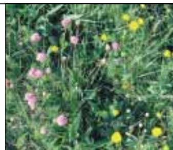
Engelskgræs og Ranunkel (smørblomst) på overdrevet om foråret

Men i 1810 besluttede de syv bønder i Nordskov at dele jorden imellem sig. De fik alle to strimler land - en sydlig og en nordlig. De syv husmænd fik en strimmel til deling. Bønderne opdyrkede jorden og lagde stenene i skellene, hvorved de mange skel blev tydelige i landskabet.