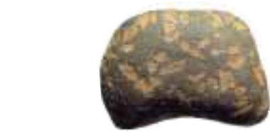
Rombe Porfyr – en sten fra Fyns Hoved

Senere i stenalderen steg havet så meget, at det nordlige Hindsholm blev opdelt i mange øer. Jøvets vestkyst er for eksempel en gammel kystklint. Senere har landet hævet sig halvanden meter og derved forbundet øerne med hinanden. Øksnehaven er naturlig tørlagt havbund, hvor øen Søbjerg er en bakke i det flade landskab.