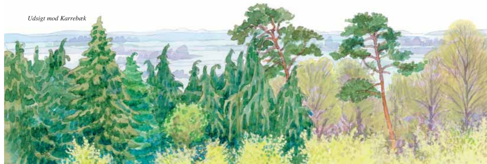
Udsigt mod Karrebæk

Rønnebækken afvander et stort landområde omkring Rønnebæk og Kalbyris. I dag er store dele af bækken og dens tilløb rørlagt under markerne og i skoven, men nord for Rønnebæksholm dukker vandet frem for at fortsætte i et nyligt restaureret vandløb vest om Rønnebæksholm og videre mod syd til Susåen ved Terbæk Huse.