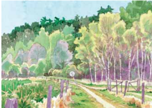
Stien mellem jernbanen og åsen