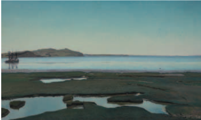
L.A. Ring "Sommerdag ved Roskilde Fjord". 1900 Olie på lærred.