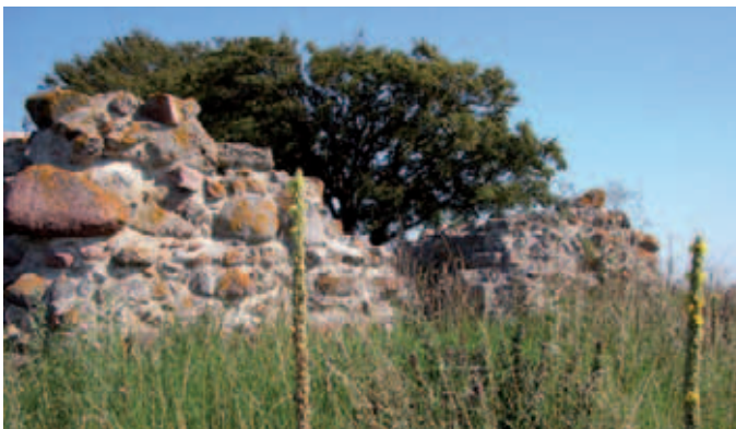
Kirkeruinen med kongelys i forgrunden.

Eskildsø (12) er med sine 140 hektarer den største og eneste opdyrkede ø i Roskilde Fjord. Øen hørte i middelalderen sammen med Selsø Hovedgård under den mægtige Roskilde-bisp. Omkring 1100 oprettedes et augustinerkloster på øen, som med sin beliggenhed lå strategisk midt i vandvejen til Roskilde. Klosteret blev dog snart flyttet til Æbelholt i Nordsjælland. Klosterets beliggenhed er aldrig fundet, men man kan se de betydelige kirkeruiner og finde en række lægeplanter, som