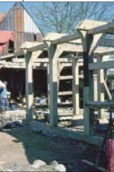
Restaurering af en staldlænge

Et omend endnu større restaureringsarbejde forestår Skov- og Naturstyrelsen med istandsættelse af de op til 5 m høje stensætninger rundt om "Slot" og avlsgård.