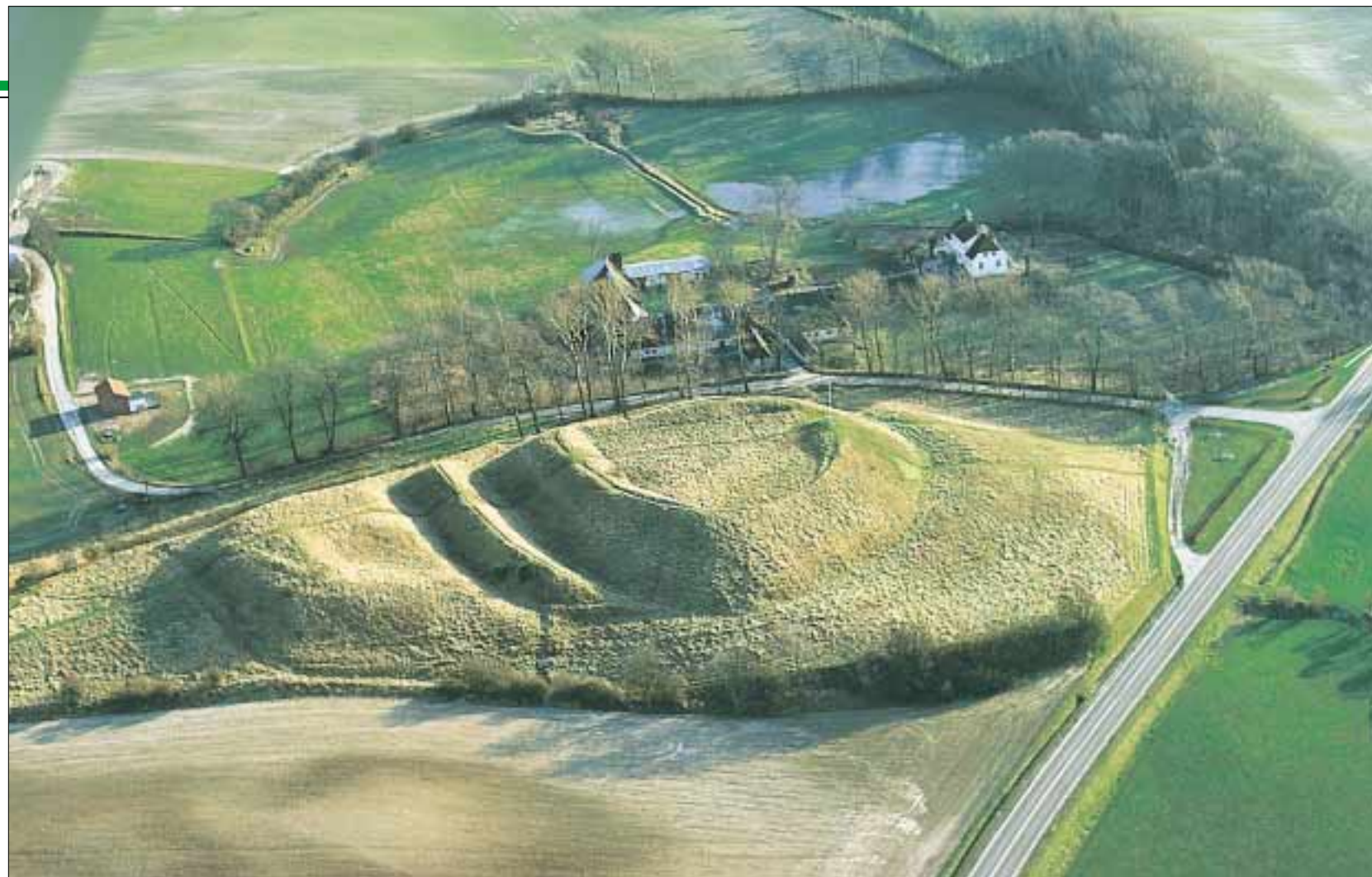
Voldstedet, hvor borgen har ligget og herregården Søbygård ved siden af (Foto fra 1994)

Ved Bromaj ⑦ er der også fundet spor af bopladser fra sten-, bronze- og jernalder.