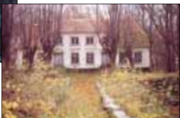
Hovedbygningen inden restaurering

Når stensætningerne er på plads vil søen rundt om hele anlægget genopstå. Avlsgårdens bygninger bliver sat i stand bid for bid, hvor alt hvad der kan bruges af de oprindelige bygningsdele bliver genbrugt.