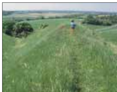
Udsigt fra voldene over Vitsø

Historien er nærværende på Bådent (lokal udtale for borgen) og Søbygård. På det imponerende voldsted har ligget en kongelig fæstning i middelalderen og Søbygård rummer stadig bygningsdele tilbage fra 1580'erne - avlsbygningerne er måske de ældste i landet.