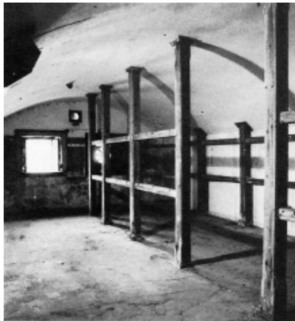
Mandskabsrum med stolper til køjer

For at sikre København blev det derfor nødvendigt at skyde forsvaret frem fra Vestvolden, der kun ligger ca. 7 km. fra Rådhuspladsen, til Tunestillingen. Tunestillingen blev anlagt i 1916 fra Mosede over Tune til Roskilde Fjord ved Veddelev, med skyttegrave, pigtrådsspærringer, artilleristillinger for 82 kanoner og mere end 5000 skudsikre rum, herunder betonstøbte maskingeværreder. En del af disse eksisterer