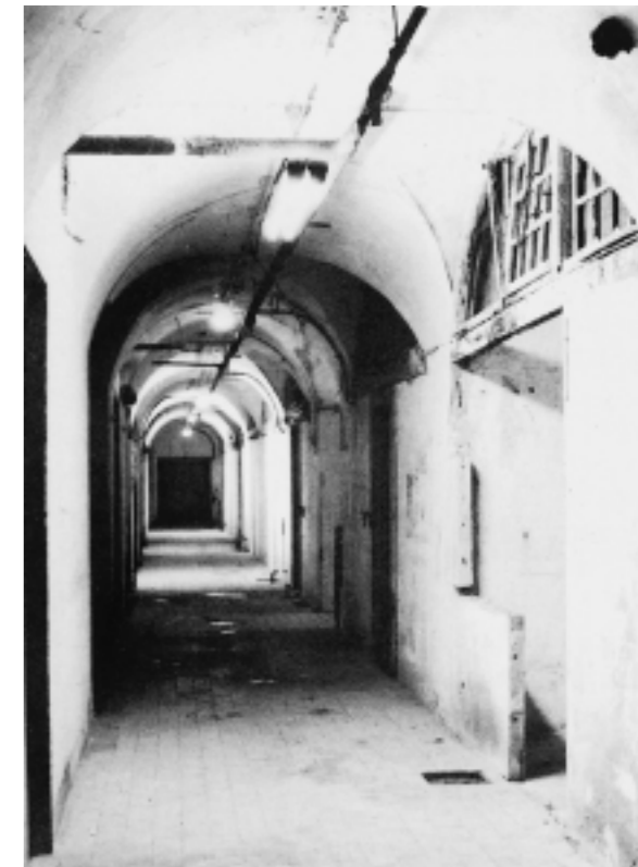
Et kig ned ad gangen i kasematten

Alle fortets betonkonstruktioner er stort set bevaret, men en del af kanon- og maskingeværstillingerne er af parkmæssige hensyn helt eller delvist tildækkede, men kan dog identificeres.