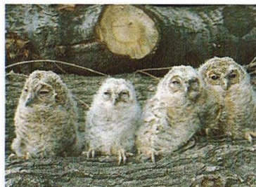
Der ruger flere natuglepar i skoven

Danmarks Naturfond driver skoven nænsomt i et bæredygtigt, naturnært skovbrug , som det hedder i nutidens sprog. Sprøjtning og gødskning bruges ikke, der lægges hovedvægt på løvtrædyrk-