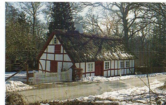
Det gamle skovfogedhus, "Skovly"

Særlig bemærkelsesværdig er forekomsten af orkidéerne, tyndakset gøgeurt og ægladet fliglæbe under de gamle aske. Under bøgene dominerer græsserne, lundragræs og flitteraks, på de fugtigere steder mosebunke og skovstar. Et enkelt sted er der skovbyg, kærhøgeskæg og sød astragal. Brombær og hindbær er meget almindelige under de gamle, lysåbne bøgebevoksninger.