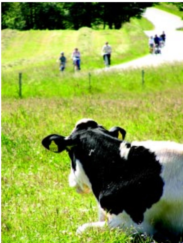
Kvæg er fredelige men skal som alle dyr respekteres