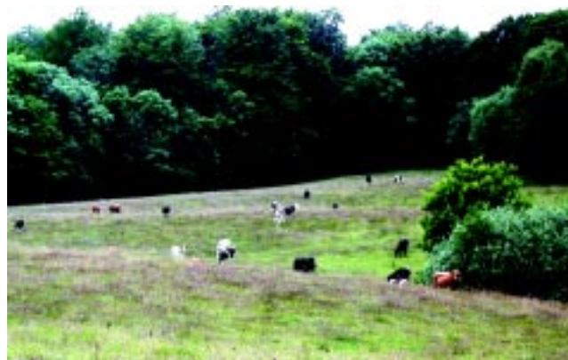
Kohaven er meget kuperet – et dødisopræne landskab