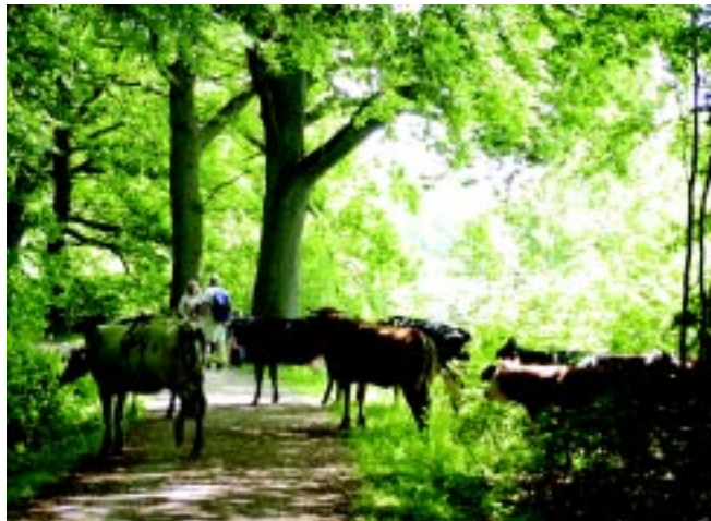
Kohaven – et sted for folk og fæ

Helsingør – Hornbæk – Gilleleje Banen (HHGB) stopper ved Hellebæk station. Endvidere går bus nr. 347 og 331 til stoppested i Nygård, hvor der er ca. 400 meter til den vestlige del af Kohaven.