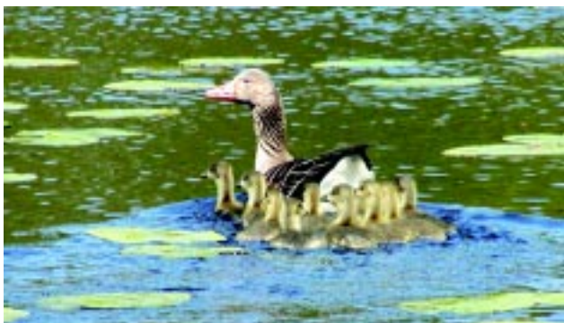
Der er andet end kvæg at se i kohaven

Hellebæk Kohave er kendt for sit store fugletræk både forår og efterår. Op mod 10.000 rovfugle trækker forbi om foråret, og om efteråret er tallet endnu større. Den mest almindelige rovfugl er musvågen, men også mange andre arter ses, bl.a. rød glente, rørhøg, havørn, fiskeørn og vandrefalk. Trane-trækket er også værd at studere. Det kan iagttages i marts og april, når vinden slår om i øst og sydøst. Så kan hundred-