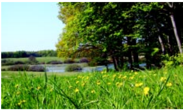
Græsning skaber en lysåben bund, der bedrer forholdene for blomster