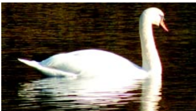
Knopsvanen er en fast gæst i Kohaven

Den mest iøjnefaldende ynglefugl er grågåsen. Den kan især ses i den nordlige del af Kohaven omkring Pernille Sø. Her kan også ses både lille og gråstrubet lappedykker. Den fugl, der høres mest, er nattergalen. Den sidder flere steder rundt i krattene, og dens klukkende stemme høres i maj og juni, især om aftenen og natten. I ellekrattene kan man få et glimt af den sjældne lille flagspætte, og fra de store, gamle egetræer høres den korttåede træløbers korte, svirrende sang.