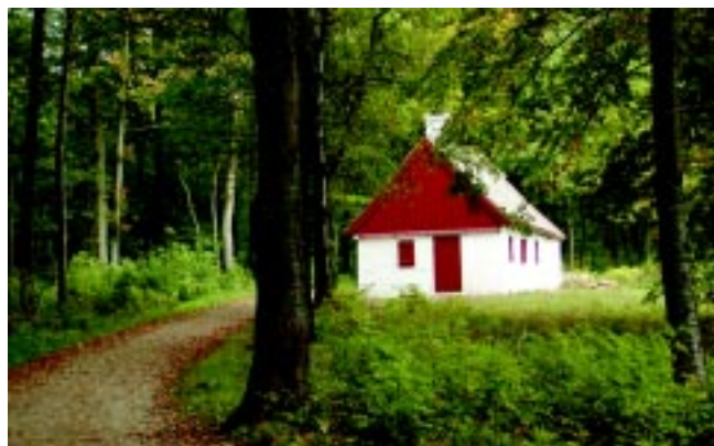
Anes hus – fuld af historie

Et overdrev defineres som en græsdomineret vegetation på tør bund uden anden påvirkning end græsning. I gamle dage fandt man overdrevene på svært tilgængelige og dermed ikke opdyrkede områder som skrænter og kupe-rede arealer. Med industrialiseringen af landbruget er overdrevene blevet en truet naturtype, som er bevaringsværdig pga. den store variation af planter og dyr. I dag er 88 truede plantearter tilknyttet overdrevet, hvilket svarer til 38% af samtlige truede plantearter i Danmark. Alle overdrev er fredet iflg. Naturbeskyttelsesloven § 3, og udgør kun 0,9 % af landbrugsarealet, eller ca. 28.000. ha.