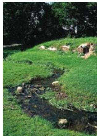
Stryget ved ruinen af Kvak Mølle, der leder fisk forbi mølledæmningen.

Navnet Skibet bliver ofte forbundet med sejlads på Vejle Å. Det har måske snarere rod i det olddanske ord "skida", som betyder kløvet planke og måske hentyder til det middelalderlige Haraldskær.