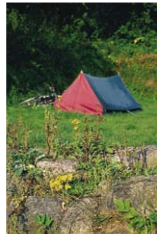
Primitiv lejrlplads ved Kvak Mølle.

Ved Kvak Mølle findes en primitiv lejrlplads, med adgang til bålplads og toilet. På Haraldskær Avlsgård er indrettet grillplads. Yderligere findes borde og bænke og mulighed for husly i Høhuset ved dæmningen langs Vejle Å. Fiskeri i Vejle Å kræver fisketegn – dagkort kan købes på turistkontoret i Vejle. Sejlads med kano er mulig på Vejle Å i perioden fra 16. juni til 31. december, dog skal man forud have erhvervet et gæstemærke fra Vingstedcentret, tlf. 7586 5533. Folderen kan fås hos RST, tlf. 7583 5999.