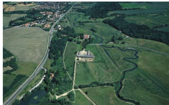
Den genslyngede å ved Haraldskær, hvor man fortsat kan se de lige afvandingskanaler.

Flere af de gamle skove på herregårdsjordene omkring Haraldskær får lov at ligge urørte. Det giver grobund for et spændende liv af svampe, insekter, urter og fugle. Samtidig skyder nye kommunale skove op på bakkerne syd for Haraldskær.