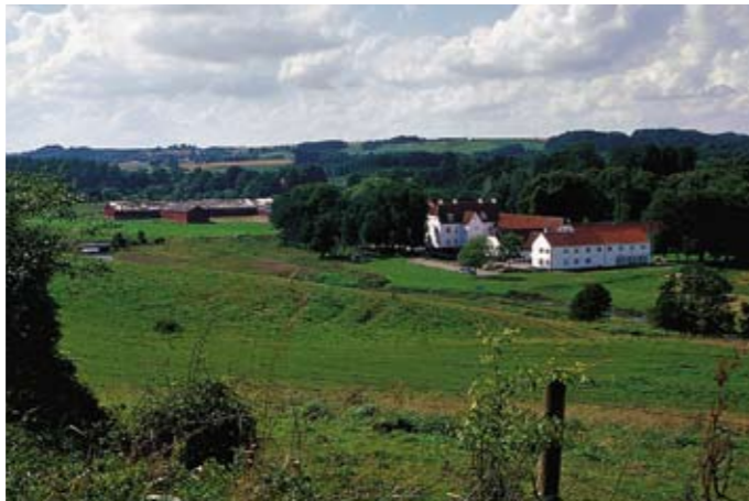
Haraldskær med hovedbygningen fra ca. 1590 og de røde avlsbygninger i baggrunden.

Haraldskær. En rigtig herregård, hvor man hver nat kan opleve en ung hvidklædt jomfru, der vandrer fra kirkegården gennem Haraldskær ned til åen. Haraldskær er kendt tilbage fra 1400-tallet, men har sikkert rod længere tilbage. Placeringen er strategisk lige ved overgangsstedet over Vejle Å, hvor kongevejen mellem Koldinghus og Skanderborg Slot tidligere passede. Hovedbygningen er i dag kursusejendom og ejes af Boligselskaberne, mens Avlsgården med de gamle herregårdsmarker og skove hører under Vejle Kommune.