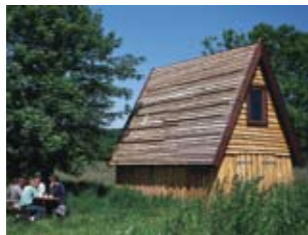
Høhuset på dæmningen.

2 Knabberup Sø. 2 km tur (ikke afmærket i felten). Vandretur på diget langs Vejle Å og Knabberup Sø. Søen er skabt ved et naturgenopretningsprojekt i 2004 og byder nu på et rigt fugleliv. Mulighed for rast ved det gamle høhus midtvejs. Retur samme vej.