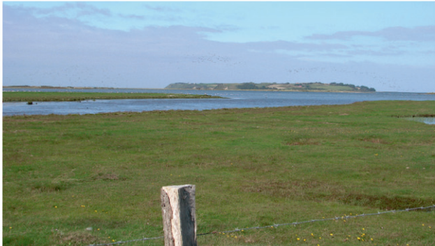
Udsigt til Nekselø i baggrunden

Kalundborg Kommune går i dag ind med naturpleje på de arealer, hvor buskene står tættest. Naturplejen består i, at man rydder nogle bæltter ind gennem krattet, så de fritgående heste og køer kan græsse på arealerne til gavn for lyng og lavtvoksende urter.